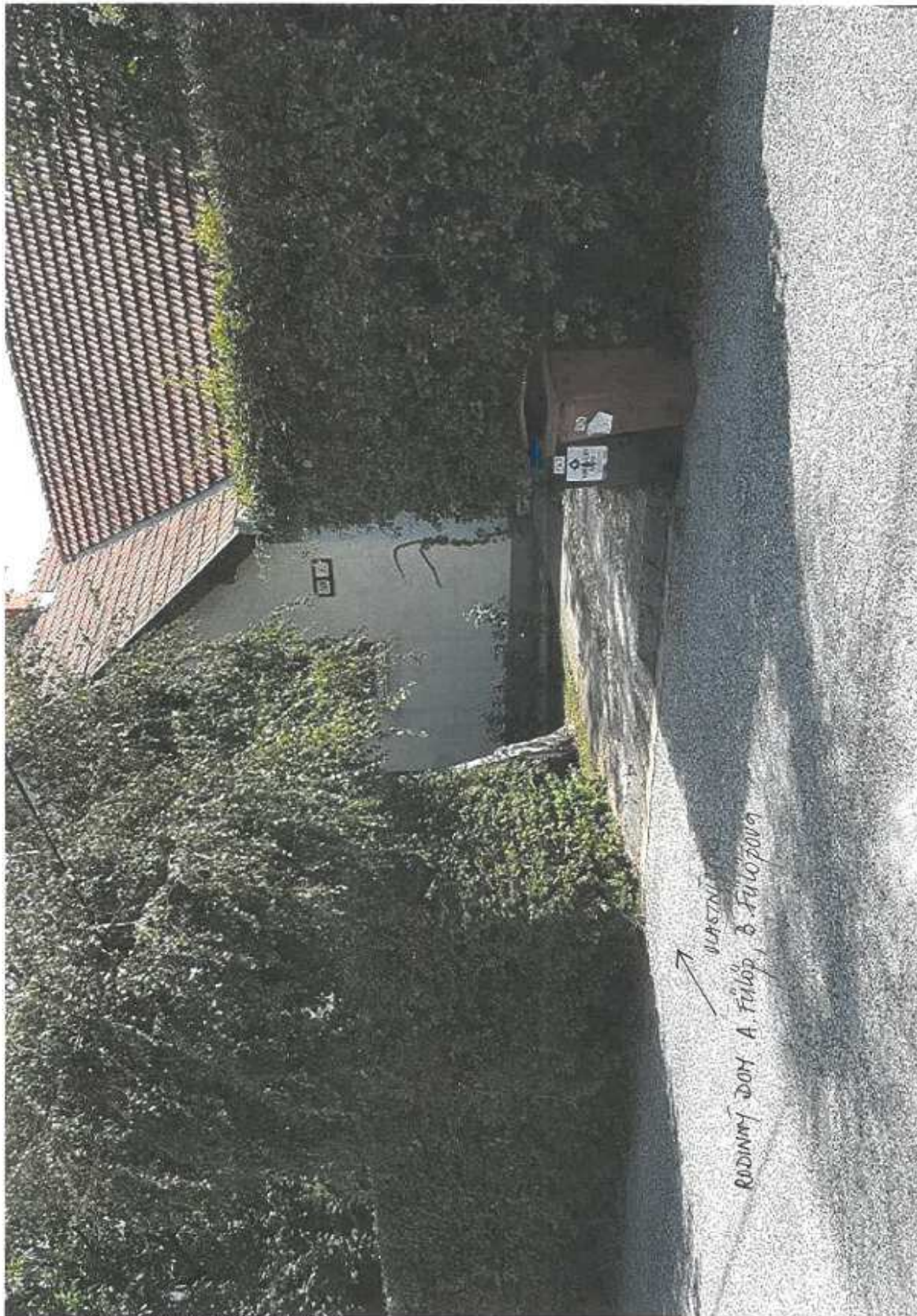
SMĚT. REKUP. PEV. HN